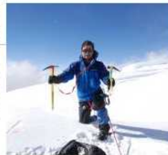
↑ On the summit 2009